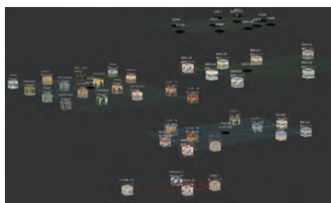
(上)MoSaIC：“カタログ”の可視化を用いたコンテンツの閲覧システム (top)MoSaIC：Content viewer using “Catalogue” visualization (下)カタログ化されたコンテンツ間の関係の可視化 (bottom)Visualization of catalogued relationships of contents

This project was launched in 2012 with the objective of creating a new virtual museum with digital technologies in its come. MoSaIC provides tailored information services for intellectual curiosity of individuals, based on open information categorization and analysis. More specifically, a graph is constructed in a digital space, with digital information as the nodes, and various information categories as the edges, and information suited to the interests of each individual is flexibly analyzed and presented by AI using network science. Our open information service using AI provides diverse usages of superabundant information in a simple and comprehensive fashion, and thereby enables multi-faceted understanding.