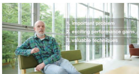
(上) 古書から読み解く日本の文化：和本の世界 (top) Japanese Culture Through Rare Books

慶應義塾大学は2016年からMOOCs(Massive Open Online Courses)開発に取り組み、2023年現在13コースを英語・日本語の2か国語（一部除く）で公開しています。特に慶應義塾が所有する貴重書や芸術作品等のアーカイブ、研究を通じた日本文化を世界に発信しています。また、コース開発の実践から得た知見を、よりよいLearning Designのための研究に活用しています。例えば、授業の履修学生がFutureLearnの同コースに登録して各自でオンライン学習を行ったあとに授業に参加する、「Blended Learning（ブレンド型学習）」の導入などにも挑戦しています。